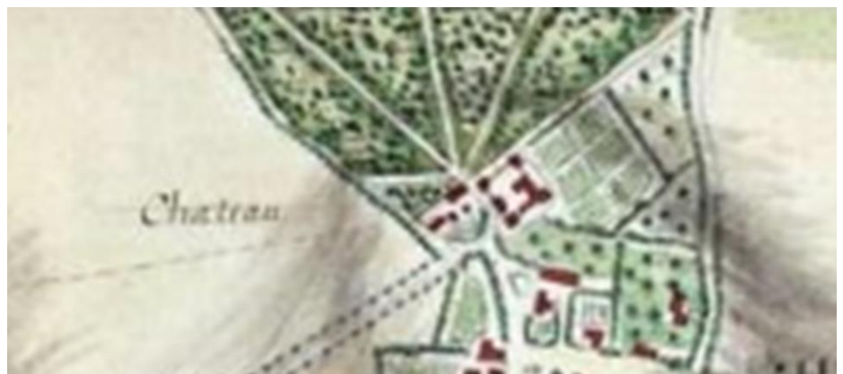
Atlas de Trudaine

Dans la seconde moitié du XVIII ème , il n'était plus que ruine.